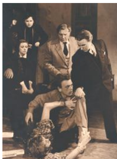
Skats no izrādes "Palmas zaļo vienmēr"