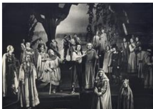
Skats no izrādes "Spēlēju, dancoju"

Bet Raiņa lugā Totam taču bija vijole! Vijole bija arī Eduarda Smiļģa Totam. Taču Harijs Liepiņš lūdza kokli – lai brīvāka stāja. Tagad, šķiet, priekšstats par Totu ilgi būs saistīts ar spēlmanīti-koklētāju.